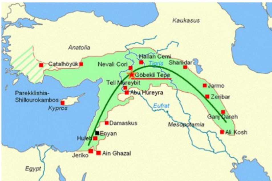
Der so genannte „Fruchtbare Halbmond“, vgl. Schädel bei Pflaunloch ( 05.01.2022 )

Die Zeitleiste ordnet die Funde ein in: Pleistozän, Eiszeit, Jungpaläolithikum / Neolithikum. Sie zeigt Zeiträume etwa zwischen 30.000 und 9.000 v. Chr. und stellt die Entwicklung bis zu frühen symbolischen Darstellungen (z. B. Venus von Lausell ) dar. (Text des Museums)