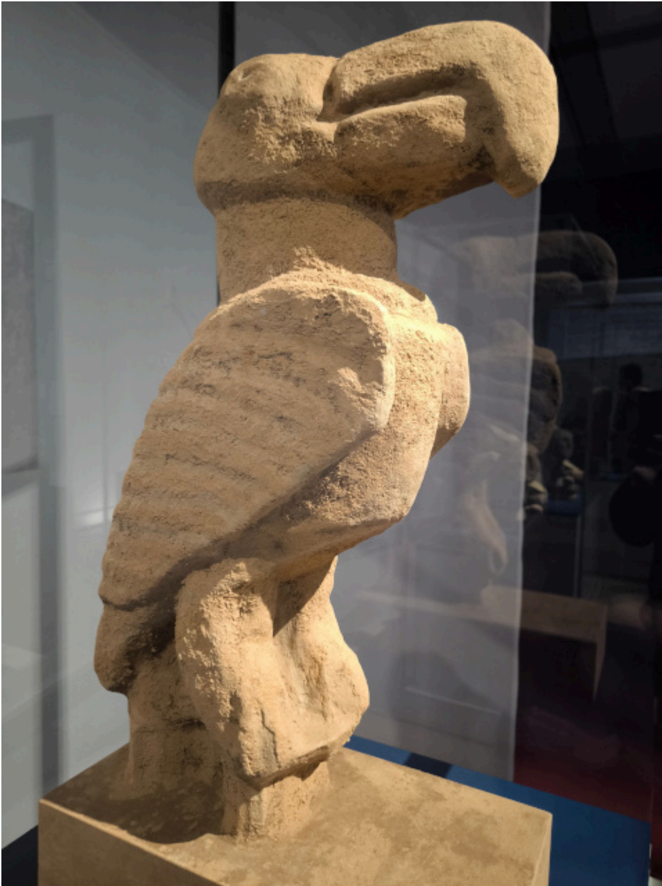
Geierstatue, Karahantepe, ca. 9400-8000 v. Chr.

Mich haben am meisten die Gesichter fasziniert, soweit man sie noch erkennen kann. Dass Menschen sich als halbes Tierwesen darstellen, ist aus allen Kulturen bekannt, von tribalistischen bis zu Hochzivilisationen. Aber was haben die gedacht? Waren die uns entfernt ähnlich? Für mich ist jemand, der an höhere Wesen glaubt, genauso weit „entfernt“ wie ein Mensch aus der Altsteinzeit.