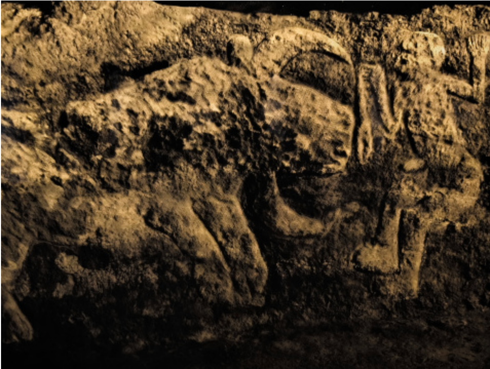
Menschliche Männliche Statue, ca. 9600-8200 vor. Chr.

Wie schon angedeutet, war ich jüngst in der Ausstellung „Gebaute Gemeinschaft – Göbeklitepe , Taş Tepeler und das Leben vor 12.000 Jahren“. (Nicht im heutigen Türkiye“, wie die staatlichen Museen beliebten zu schreiben, sondern in der heutigen Türkei.)