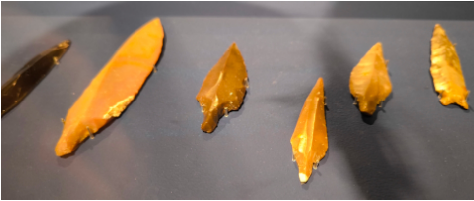
Pfeilspitzen Typ Byblos. Material: Feuerstein, Fundort: Gürcütepe. Datierung: 7.500–7.000 v. Chr. Şanlıurfa Museum, Türkei