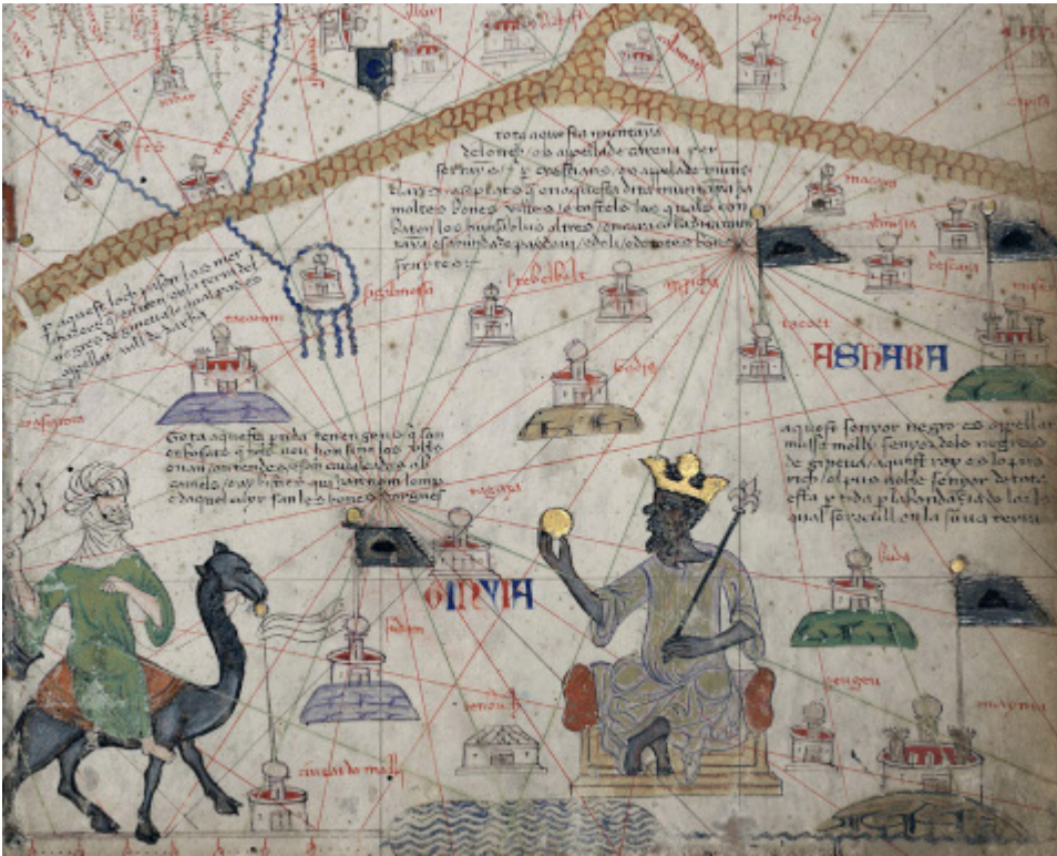
Mansa Musas auf einer Karte des Katalanischen Weltatlas von 1375, mit einem goldenen Zepter in der linken und einem Goldklumpen in der rechten Hand

Zuerst das Wichtigste. Es geht um den reichsten Mann der Welt. Mansa Musa , der berühmteste Herrscher Malis, unternahm 1324 eine Pilgerreise von rund 7000 Kilometern mit mehr als 60.000 Menschen – darunter 12.000 Sklaven – nach Mekka und gab in Kairo so viel Geld aus, dass er eine Inflation auslöste, die mehrere Jahre anhielt.