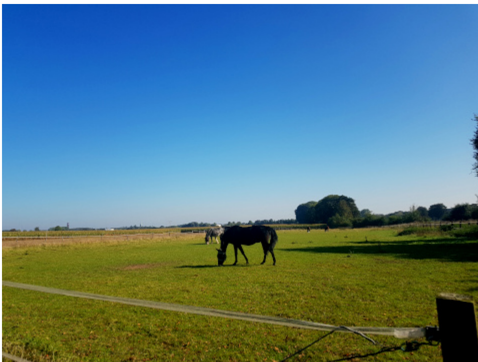
Foto oben: Methler , Foto unten: Westick . „Die Bodenfunde in Westick, einem germanischen Handelsplatz mit hohem Anteil römischen Fundmaterials, weisen aber auf weitaus ältere Besiedelung im Bereich Methler hin.“

Kann der Stein oben weg und muss diese Kultur gecancelt